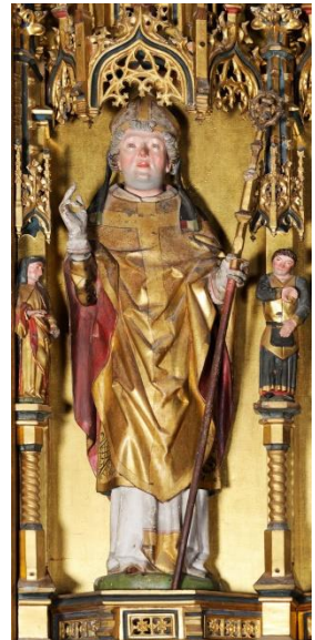
Sint-Nicolaas door Hermen Rode op het middelste achterpaneel van het altaar in de Niguliste

Het prachtige hoofdaltaar, gespaard tijdens de bombardementen, werd gemaakt in 1480 door Hermen Rode (1430-1504) uit Lübeck. Het polyptiek heeft dubbele zijluiken bij een uit houtsnijwerk bestaand middenpaneel (op de foto hiernaast bedekt). Het toont op de zijpanelen schilderingen met