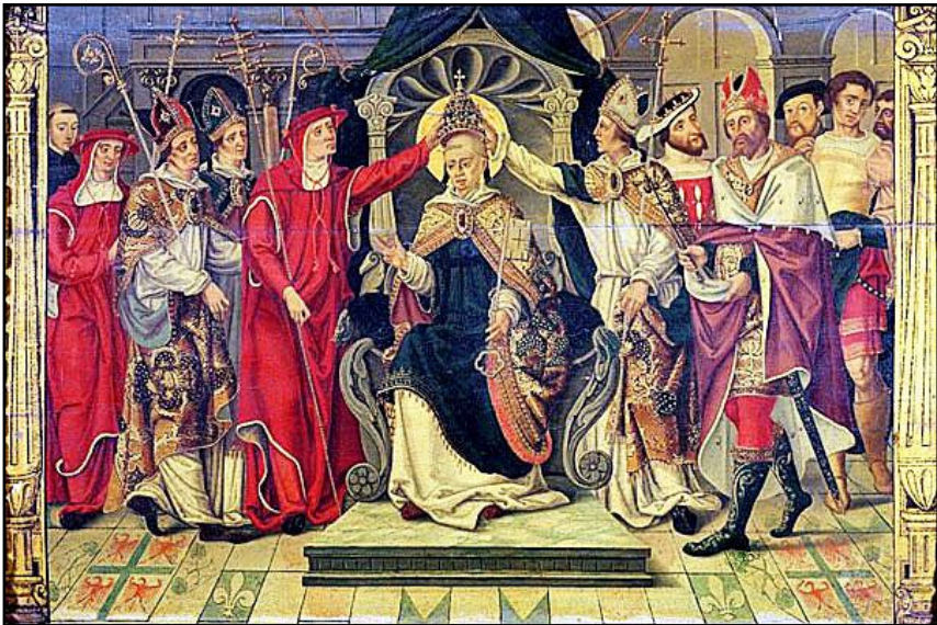
Kroning van Celestinus V in Aquila. Onbekende schilder. Depot Louvre, Parijs

De nieuwe paus accepteerde met tegenzin zijn verkiezing. Karel II dwong Celestinus na zijn kroning in Aquila, aan de buitengrens van het kerkelijk grondbezit, te resideren in Napels. Als belangrijke beslissingen die Celestinus heeft genomen zijn o.a. het in eerherstel brengen van de conclaafregels opgesteld door paus Gregorius X ( paus van 1-9-1271 tot 10-1-1276), ongetwijfeld ingegeven door de lange duur van zijn uitverkiezing, alsmede het benoemen van twaalf, de koning welgevallige kardinalen, wellicht ter inhuldiging van de stroming om de Heilig Geest meer bij het kloosterleven te betrekken (Jacopone da Todi). Van de twaalf waren er 7 van Franse afkomst. Zij waren niet allemaal monnik, onder hen waren ook de aartsbisschoppen van Lyon en Bourges. Ook heeft Celestinus Karels zoon, de latere H. Lodewijk, tot aartsbisschop van Toulouse benoemd.