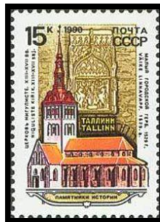
Sovjet Unie 1990 Nr 6115