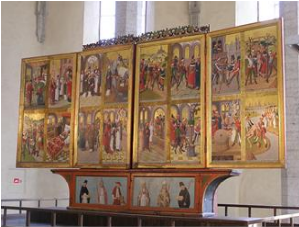
momenten uit het leven van Sint-Nicolaas van Myra.

Het prachtige hoofdaltaar, gespaard tijdens de bombardementen, werd gemaakt in 1480 door Hermen Rode (1430-1504) uit Lübeck. Het polyptiek heeft dubbele zijluiken bij een uit houtsnijwerk bestaand middenpaneel (op de foto hiernaast bedekt). Het toont op de zijpanelen schilderingen met