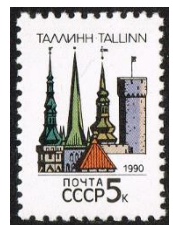
Sowjet Unie 1990, MiNr 6047