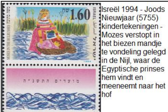
Israël 1994 - Joods Nieuwjaar (5755) kindertekeningen - Mozes verstopt in het biezen mandje te vondeling gelegd in de Nijl, waar de Egyptische prinses hem vindt en meeneemt naar het hof

De farao wilde namelijk alle Hebreeuwse jongetjes die geboren werden, onmiddellijk bij- of vlak na de geboorte doden om zo successievelijk het Joodse volk uit te roeien en Sifra en Pua, als hoofd van het vroedvrouwengilde moesten daar voor zorgen. De pas geboren meisjes mochten blijven leven.