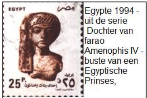
Egypte 1994 - uit de serie Dochter van farao Amenophis IV - buste van een Egyptische Prinses,

( Naschrift: Mozes was 80 jaar toen hij met zijn broer Aäron de farao Ramses II ontmoette, om te pleiten het Hebreeuwse volk te laten gaan. Ramses II regeerde 66 jaar. Het is dus niet denkbeeldig dat zijn voorganger 'Seti I' de opdracht gaf tot de kindermoord. Farao's naam wordt in elk geval niet genoemd in Exodus 1. ).