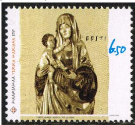
Maria en Kind door Hermen Rode. Houtsnijwerk in de Niguliste. 2001 MiNr 411

Het middelste binnenpaneel is een voorbeeld van minutieuze schrijnwerkerskunst. Vele heiligen – waaronder Sint-Nicolaas – zijn hierop te vinden.