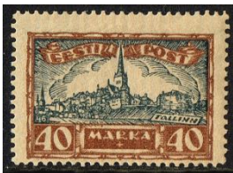
1927 MiNr 67 Uiterst links de Niguliste

Ook in Estland kreeg de Lutherse Reformatie voet aan de grond. Zoals in veel landen ging dat gepaard met vernietiging van beelden. In Tallinn gebeurde dat in 1523/24. De Sint-Nicolaaskerk bleef als enige kerk onbeschadigd omdat de priester van de kerk gesmolten lood in de sloten liet gieten, waardoor de deuren hermetisch gesloten bleven.