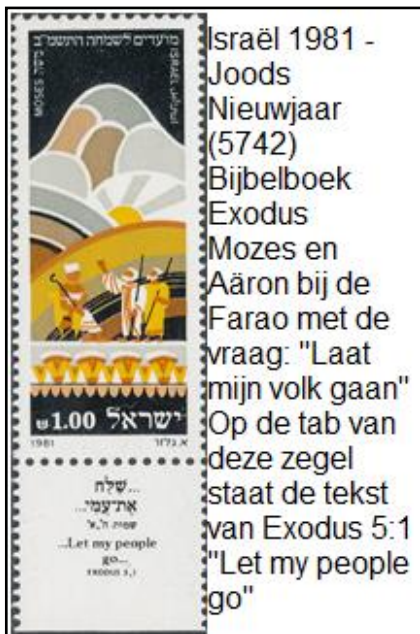
Israël 1981 - Joods Nieuwjaar (5742) Bijbelboek Exodus Mozes en Aäron bij de Farao met de vraag: "Laat mijn volk gaan" Op de tab van deze zegel staat de tekst van Exodus 5:1 "Let my people go"