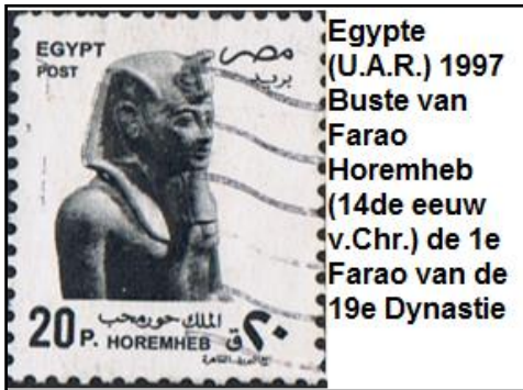
Egypte (U.A.R.) 1997 Buste van Farao Horemheb (14de eeuw v.Chr.) de 1e Farao van de 19e Dynastie

van deze aanwas want het aantal Joodse mensen was intussen groter geworden dan dat van de Egyptenaren ( Exodus 1:9 )